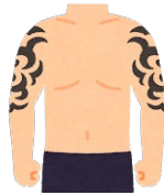
アートメイク (眉・アイラインなど) タトゥー