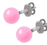
アクセサリー (ピアス・指輪)