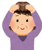
かつら・ヘアピン