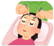
まつげエクステ つけまつげ