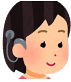
人工内耳 人工中耳