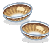
カラーコンタクトレンズ